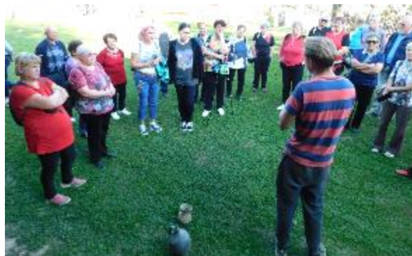
Seznaili smo se tudi s panonskim lončarjenjem

Polni vtisov, dobre volje in nasmejanih obrazov smo se zvečer vrnili v domači kraj. Vsi smo bili enotnega mnenja, da je bilo „lušno“ in da komaj čakamo naslednjih pustolovščin.