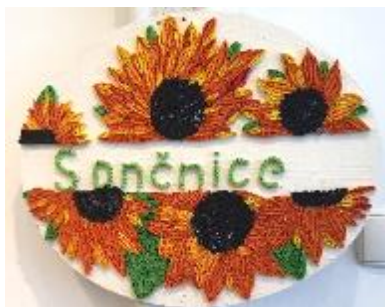
Eden izmed številnih izdelkov Sončnic DI Hrastnik

Članice Sekcije ročnih del DI Hrastnik, imenovane Sončnice, se srečujejo vsak teden. Srečanja so namenjena predvsem izdelovanju različnih unikatnih izdelkov, pripravam na sodelovanje na različnih razstavah in ustvarjalnih delavnicah ter seveda izmenjavi novih spoznanj in izkušenj.