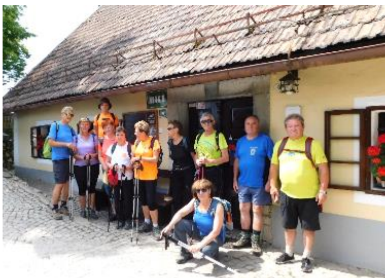
Šmarno goro smo osvojili po kratki, a precej strmi poti

Pohod smo pričeli z javnimi prevoznimi sredstvi, torej z vlakom in avtobusom LPP. Pripeljali smo se vse do Tacna in spoznali, da nihče izmed zbranih še ni hodil po tej strani na Šmarno goro. Smo pa kar kmalu spoznali, zakaj smo se do sedaj ogibali te poti... Najprej smo hodili med hišami, nato pa v gozdu kar hitro navkreber. Številne korenine na gozdni poti, suha zemlja in visoki koraki med koreninami so nas počasi utrudili na sicer precej kratki poti proti vrhu Šmarne gore. Tudi sonce, ki je kljub senci v gozdu kar pripekalo, je botrovalo naši zadihanosti. Po dobri uri naporne hoje smo vendarle vsi prisopihali na vrh. Z vrha pa čudoviti pogledi proti Ljubljani in okoliških vrhovih, ki so bili sicer zaradi vročine v nekakšni megli. Na vrhu stoji ob cesti tudi zvonček, na katerega smo pozvonili, si zaželeli kakšno željo in se nato počasi odpravili nazaj po nam