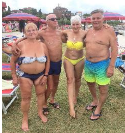
Takole smo uživali in pozirali v Portorožu