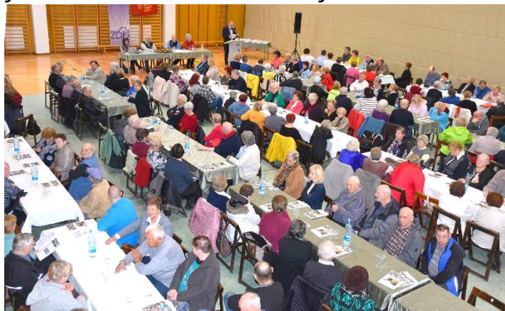
Zasedali smo v Športni dvorani na Logu

Ob okusni jedači in pijači se je začelo veselo druženje in kramljanje. Iskrena zahvala vodstvu društva, ki je stopilo skupaj in kljub težki situaciji uspešno izvedlo pozitivno poslovanje.