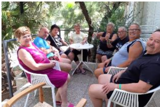
Tudi senca nam je prijala ☺