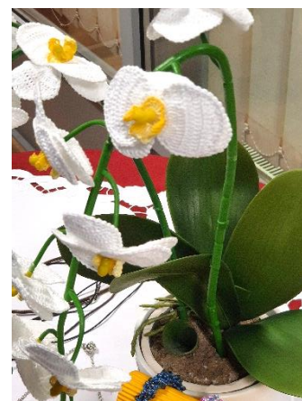
Tudi trboveljske Zlatice so prave ročne mojstrice

Z ogledom razstav Sončnice vedno preživljajo lepe večere v družbi poznavalk izdelovanja izdelkov ročnih del, hkrati pa dobijo tudi kakšno idejo za nadaljnje ustvarjanje.