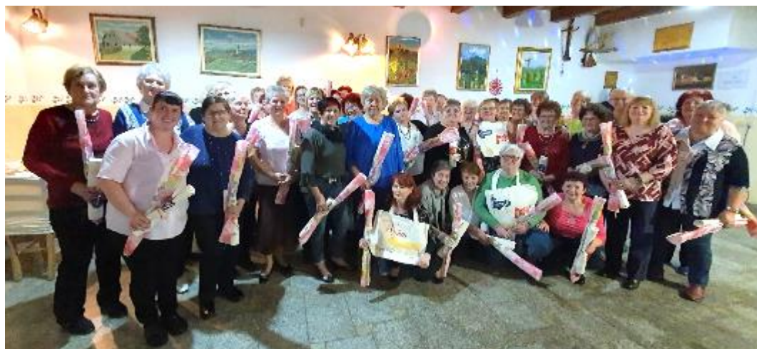
Letošnji cvet praznovanja dneva žena