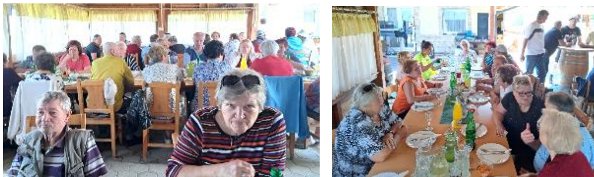
Pri Ačku smo že kar domači

Nekateri so čas porabili za uživanje ob kulinarčni ponudbi in pogovoru, spet drugi pa so se po svojih zmožnostih zavrteli na plesišču. Vsi pa smo se strinjali: lepo preživet dan!