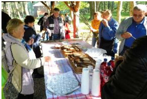
Ste že okušali pajani kruh? Mi smo ga!

Naša prva postaja je bila Krajevna skupnost Ižakovci. Tu je reka Mura ustvarila naraven otok, ki so ga domačini poimenovali Otok ljubezni v spomin na prepovedano ljubezen med grofico in mlinarjem, ki se ni srečno končala. Nekaj deset metrov naprej smo si ogledali razstavo Bujraštvo na Muri in se seznanili s predelavo lanu od preje do tkanja in končnih izdelkov. Brod na reki Muri ni obratoval, saj so poplave terjale svoj davek in voda je potrgala jeklene vrvi. Za konec ogleda so nam pripravili pajani kruh.