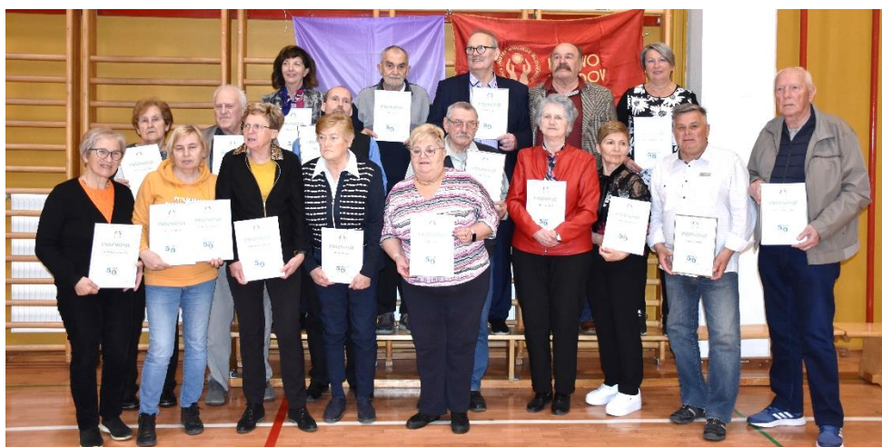
Prejemniki priznanj za dolgoletno aktivno delo v DI Hrastnik