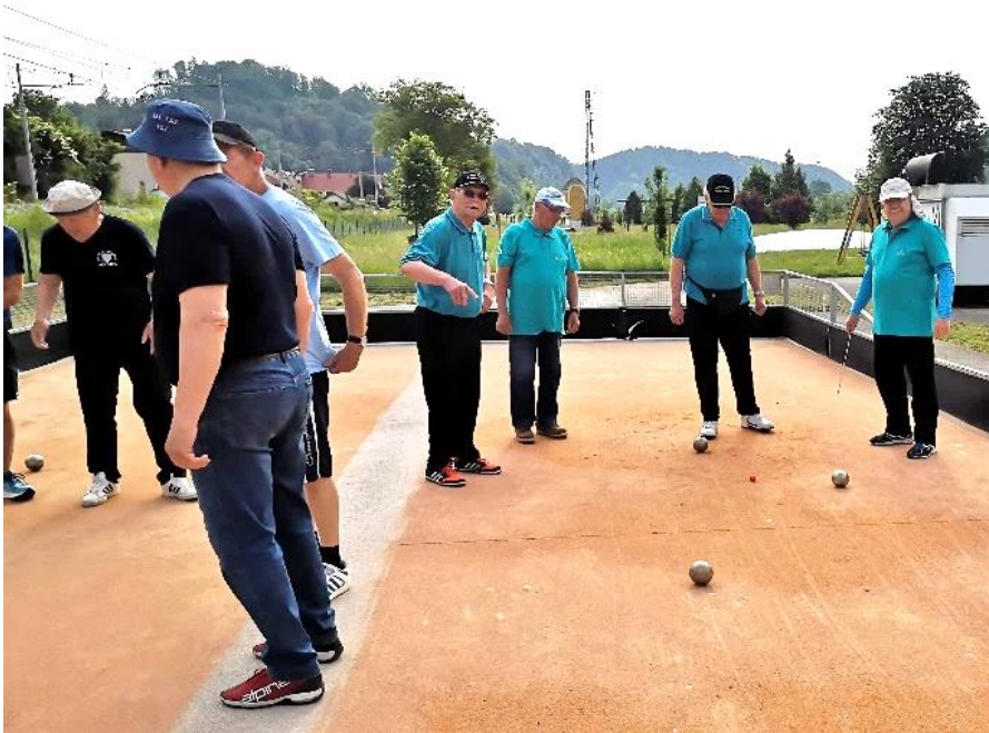
Tudi balinarji so se ob jubileju DI Sevnica zbrali in zavzeto odigrali