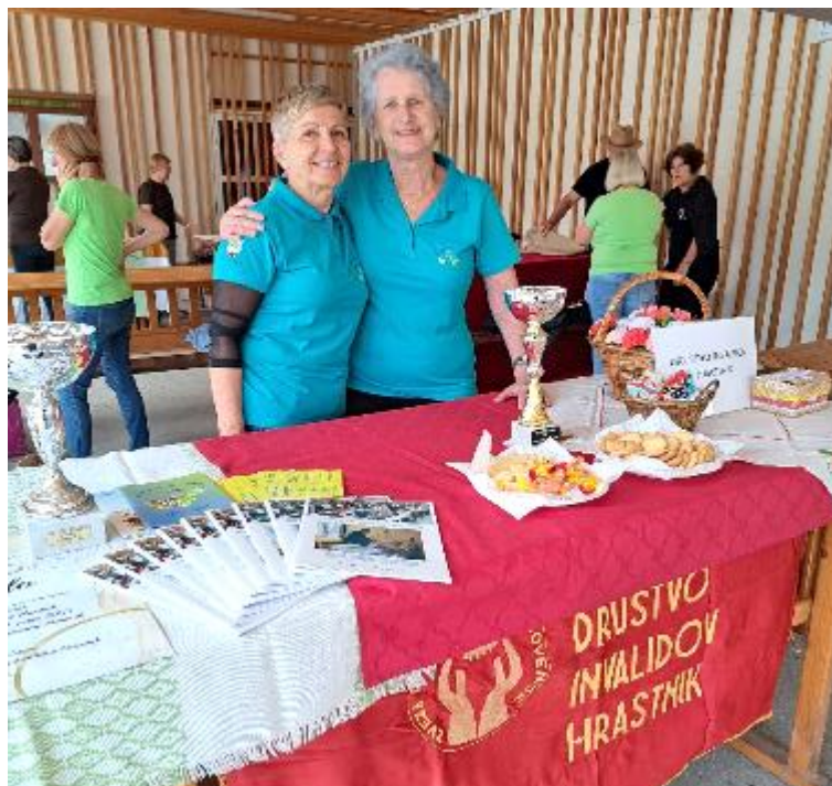
Vida in Slavi sta že uigran par pri informiranju o aktivnostih našega društva

Vzdušje je bilo prijetno, pa še vreme nam je bilo naklonjeno.