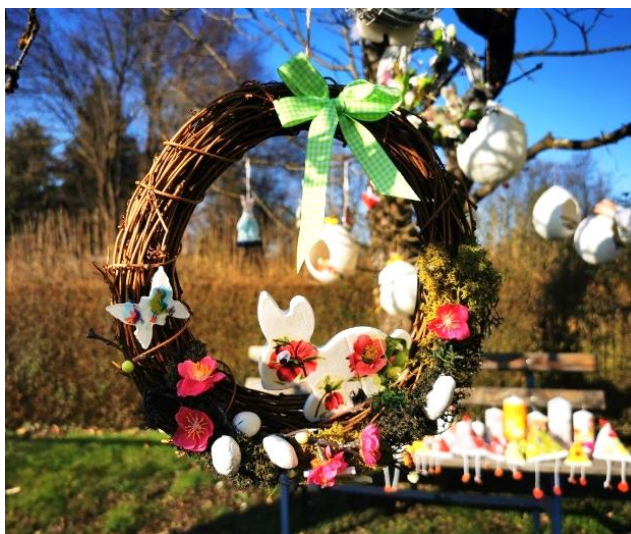
Velikonočne dekoracije članic ZDIS so še olepšale Radence

Novo pridobljena znanja z ustvarjalnih delavnic ZDIS nato udeleženke delavnic z veseljem posredujejo ostalim članicam sekcije ročnih del oz. Sončnicam.