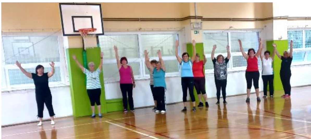
Srede so rezervirane za razgibavanje v telovadnici

Redno se dobivamo, da malo razgibamo naše ude. Ne pozabimo pa niti na ustno aerobiko, ko razpravljamo o naših problemih. Smo pa res same punce... Junaki, kje ste? Pridružite se nam in poskrbite za svoje zdravje!