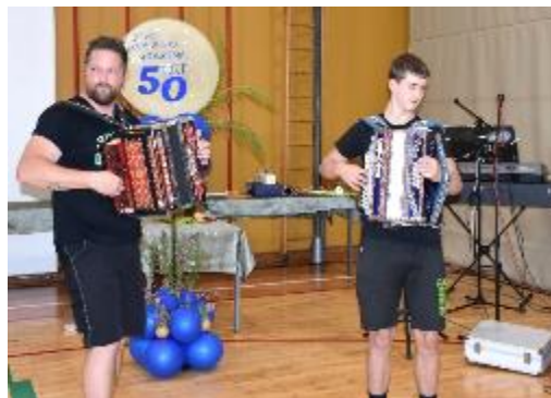
Proslavo je obogatil pester kulturni program