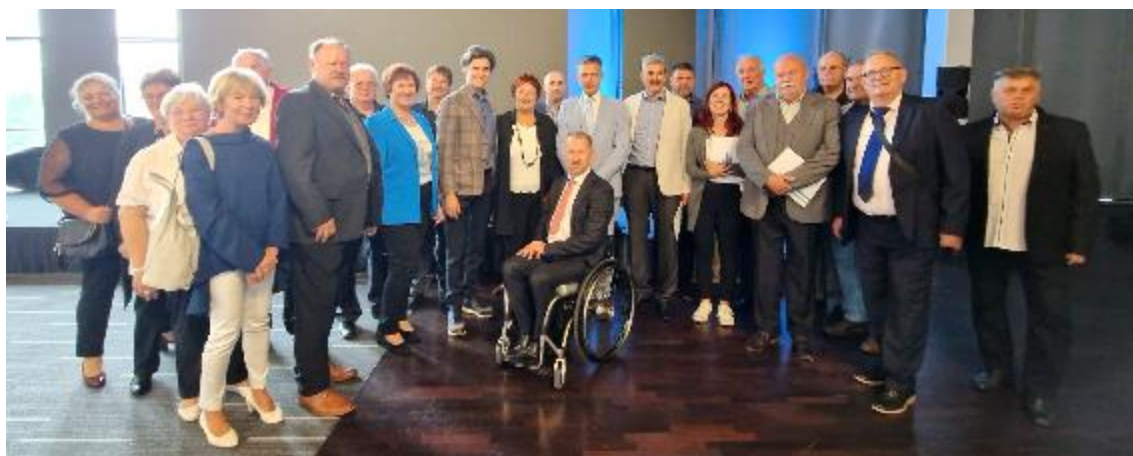
FIHO, vse najboljše!