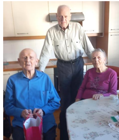
Obisk naših najstarejših članov v Domu starejših Laško