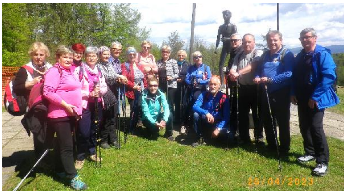
Udeleženci prvega planinskega pohoda v letu 2023

Za prvi pohod v letu si je planinska sekcija DI Hrastnik izbrala vzpon na Toško Čelo. Ime hriba zveni sicer kot da gre za zahtevno goro nekje v Kamniških Alpah, pa vendar je Toško Čelo hrib v bližini Ljubljane, visok le 590 metrov in leži nad istoimensko vasjo.