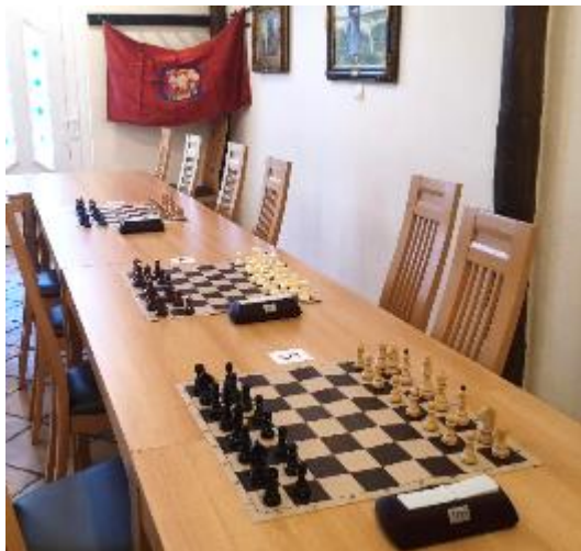
Vse pripravljeno za začetek tekmovanja, a šahovnice niso dolgo samevale

(DI Hrastnik, 5 točk), 4. Franc Drstvenšek (DI Sevnica, 4 točke), 5. Milan Laznik (DI Hrastnik, 3 točke), 6.-7. Drago Hribšek (DI Hrastnik, 2 točki) in Damijan Škerbec (DI Sevnica, 2 točki), 8. Viljem Vrečar (DI Hrastnik, 1 točka). Hvala Sevničanom za lepo skupno jubilejno tekmovanje.