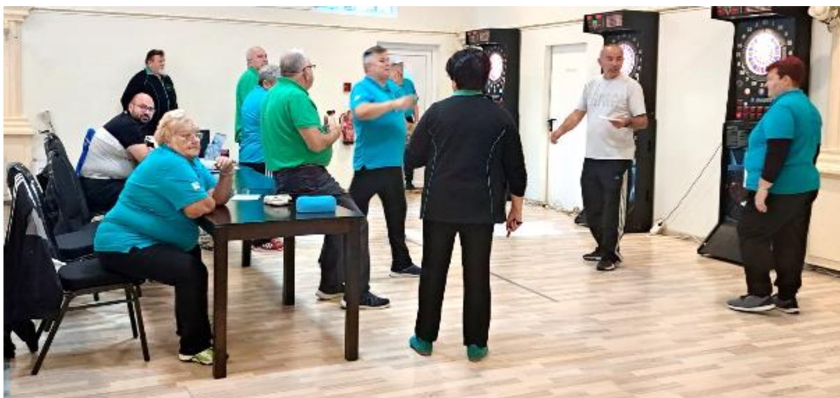
DI Hrastnik je poskrbelo, da je tekmovanje potekalo skladno z vsemi pravili

Tako ženska kot tudi moška ekipa DI Hrastnik sta se uvrstili v zlato sredino, obe sta namreč zasedli 5-6 mesto. Sama uvrstitev naših ekip morda res ni ravno bleščeča, smo pa lahko ponosni, se je pa DI Hrastnik znova izkazalo kot zaupanja vreden organizator območnega tekmovanja pod okriljem ZDIS.