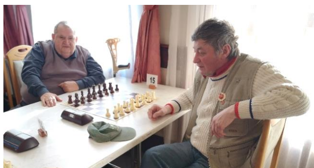
V kraljevski igri ni prostora za napake, če se želiš uvrstiti na državno prvenstvo