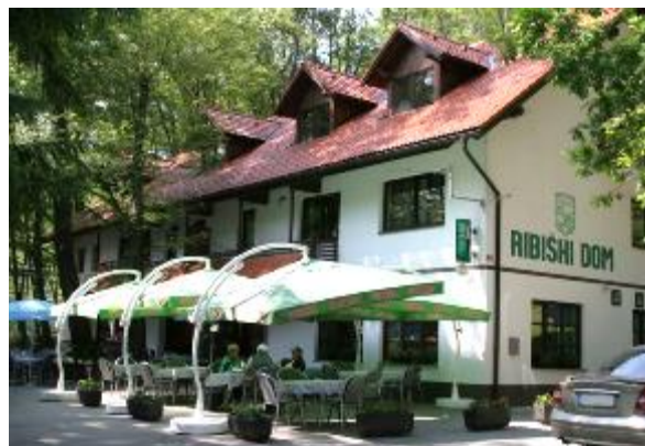
Ribnik Mačkovci – v takšnem okolju so lovili in uživali ribiči na območnem tekmovanju