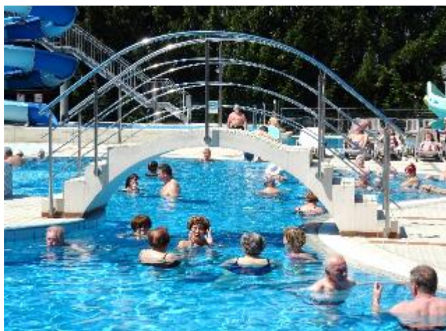
Takoj, ko posije sonce, se „namakamo“ zunaj