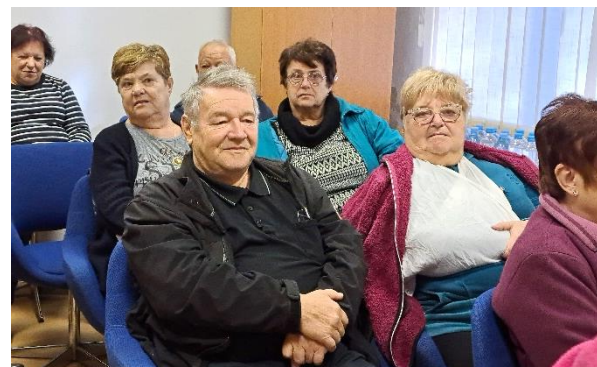
Predavanju o zdravem življenjskem slogu smo prisluhnili v sejni sobi DI Hrastnik