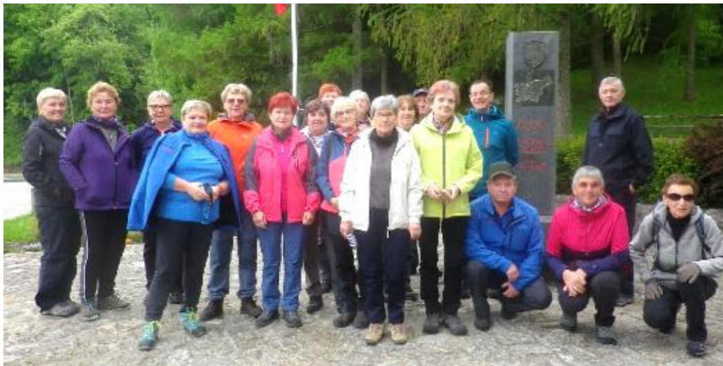
Naši planinci na geometričnem središču Slovenije

V planinskem domu smo se spočili, nekaj popili in pojedli ter pot nadaljevali proti Kostrivnici in naprej proti Vidrgi, kjer nas je že čakal avtobus za povratek domov. Zanimiv pohod, ki nam je nudil gibanje, druženje, nekaj kulture in zgodovine.