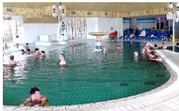
Kako se prileže prvo skupno kopanje v letu...

Po postanku smo pot nadaljevali do Term Banovci, kjer nas je sprejela uslužbenka na recepciji. Sledilo je celodnevno kopanje, vmes odlično kosilo in verjemite, bilo je enkratno vzdušje in resnično smo se imeli lepo. Moramo pa priznati, da nas je termalna voda tudi dokaj utrudila in vsi smo se veselili povratka domov. Seveda pa ni šlo brez postanka, zadnjega smo opravili v restavraciji Hochkraut med Celjem in Laškim, da smo si kupili še okusne kremne rezine za domov. V Hrastnik smo se vrnili ob osmi uri zvečer, vsi prijetno utrujeni in zadovoljni.