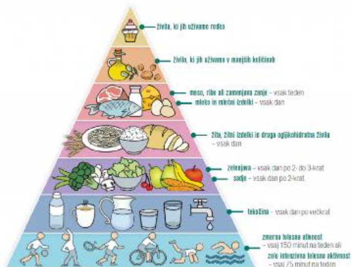
Najnovejša shema zdravega prehranjevanja

Hvala Tamari Zemljak za zanimivo predavanje in praktično delavnico.