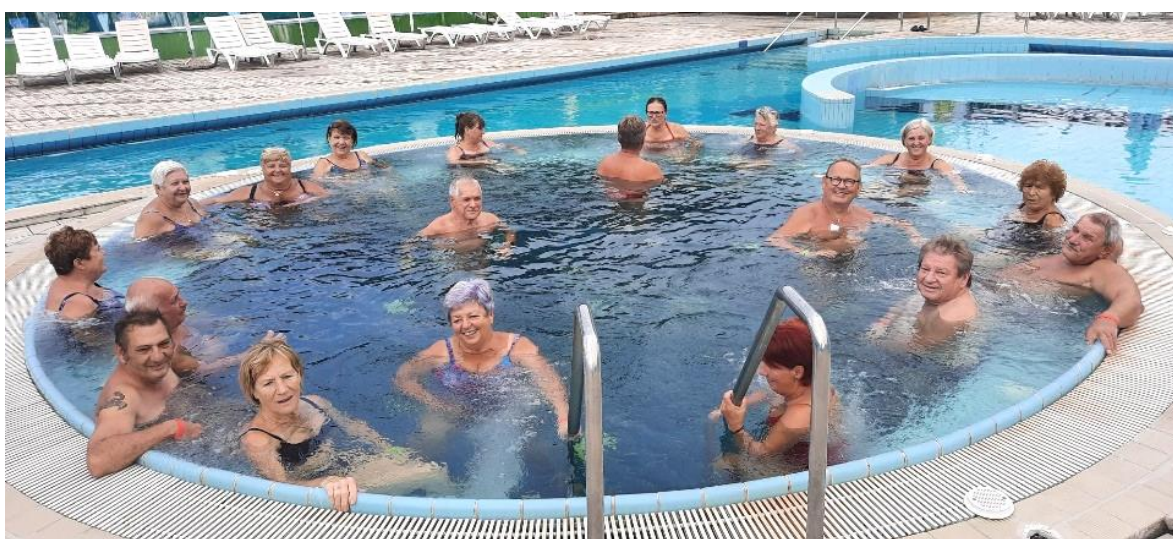
Rečeno, storjeno! Znova v Biotermah Mala Nedelja

Na poti domov grede smo se oglasili še po kremne rezine v gostišču Hochkraut, nato pa je počasi sledil čas poslavljanja. Pred slovesom pa smo se vsi zbrani strinjali, da so naša kopanja zelo blagodejna za telo in dušo, zato smo sklenili: še bomo šli!