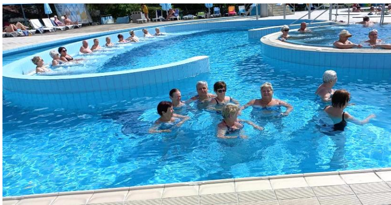
Bioterme Mala Nedelja so super! Jeseni se vrnemo!

Bioterme Mala Nedelja ležijo v osrčju Prekije južno od Ljutomera in je prvi okolju prijazen hotel. S ponudbo Bioterm smo bili izredno zadovoljni. Če bi bilo le mogoče, bi kopanje še podaljšali za kakšno urico, vendar čas je bil za odhod domov. Vemo namreč, da nas tako zaželeni kopalni dnevi vendarle ne smejo preveč utruditi. Poleg tega pa smo se že veselili tudi prihodnjih kopanj na slovenski Obali.