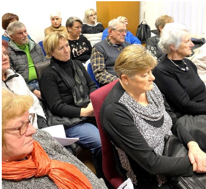
Zbrani ob slovenskem kulturnem prazniku

Preživali smo lep kulturni dan v sejni sobi DI Hrastnik, ki pa je bila 6. februarja kar premajhna za vse udeležence.