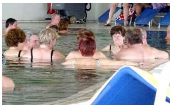
Tudi kramljanje v zdravilni vodi smo že pogrešali