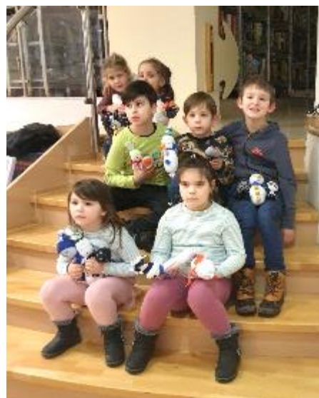
Naša dekleta so pomagala, mladi nadobudneži pa so se razveselili novih lutk 😊

V okviru materinskega praznika so se pridne in spretnke Sončnice odzvale povabilu Knjižnice Antona Sovreta Hrastnik in Osnovne šole narodnega heroja Rajka Hrastnik ter prikazale tehniko izdelovanja rož iz različnih materialov. V hrastniški knjižnici so prikazale izdelovanje različnih rož iz krep papirja, biba palčk, mafinov, barvnih plastičnih vrečk in celo iz zaščitnih mask. Zadovoljni otroci in njihovi starši so z veseljem lepili, rezali in zvijali, na koncu pa celo sami sebe presenetili s čudovitimi izdelki. Z učenci 5. razredov Osnovne šole narodnega heroja Rajka, tako v Hrastniku kot na Podružnični šoli Dol pri Hrastniku, pa so Sončnice izdelovale cvetje iz krep papirja. Z izdelanim cvetjem so otroci naslednji dan razveselili svoje mamice za njihov praznik. Delo je potekalo v prijetnem in ustvarjalnem vzdušju. Še zlasti v 5. razredu na Dolu, kjer se je delavnice udeležilo kar 13 dečkov in 2 deklici. Najprej so imele Sončnice sicer malo pomisleka o uspehu delavnice, glede na veliko število dečkov, ki običajno niso ravno bleščeči pri tovrstnih ročnih spretnostih. A dolski dečki petošolci so se več kot le izkazali, presenečenje je bilo popolno. Izpod njihovih rok so namreč nastali čudoviti šopki spomladanskih žafranov, mnogi so izdelali še celo dodatne cvetlice za svoje babice. Čudovite delavnice! Seveda pa gre posebna zahvala učiteljicam in knjižničarkam, ki so sodelovale pri izdelovanju in tudi same ustvarjale skupaj z otroki.