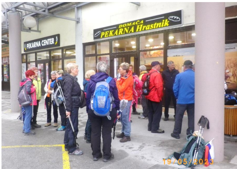
Naše običajno zbirališče – Tržnica Hrastnik

Pot nas je najprej vodila na GEOSS – geometrično središče Slovenije. Zasnovan je kot domoljubni vseslovenski projekt, simbol slovenstva, večstoletnega prizadevanja za obstoj in razvoj ter zakoreninjenost Slovencev na tem prostoru, zato se tu odvijajo različne domoljubne proslave. Naš namen pa je bolj obisk gora, zato je bil postanek na tem težišču Slovenije zgolj drugotnega pomena, predvsem, da smo žigosali naše dnevnikarje Zasavske transverzale. Seveda pa smo si iz radovednosti tudi ogledali lepo urejen prostor, namenjen proslavam.