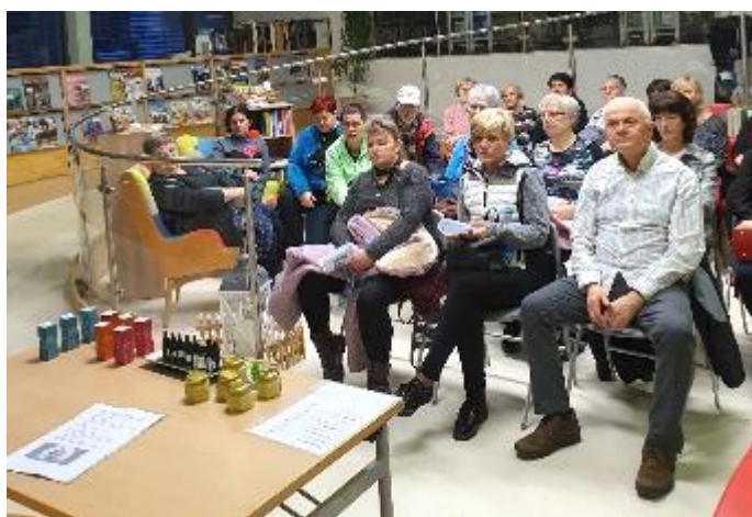
Konoplja nas zanima