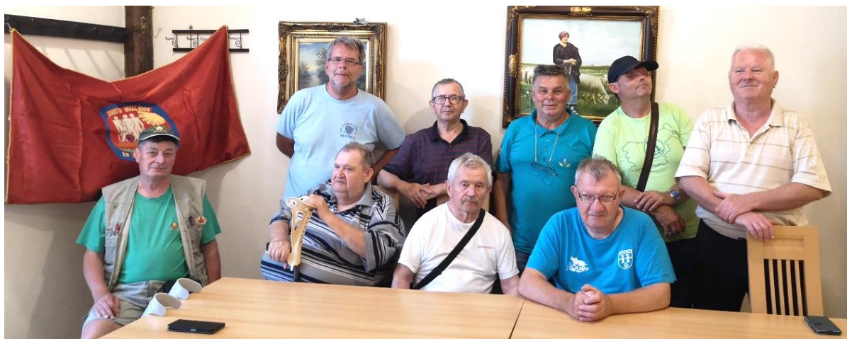
Hrastniški in sevniški šahisti, ki so v svojem slogu obeležili 50-letnico DI Hrastnik