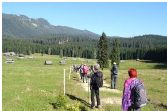
Res lepe so naše planine... ☺

Ni kaj, resnično smo odlična skupina pohodnikov, glede na to, da smo invalidi in tudi ne več rosno mladi. Se že veselimo novih organiziranih pohodov v naslednjem letu! Pridružite se nam!