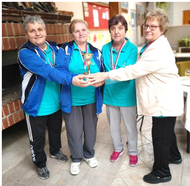
Balinarke so se vrnile s pokalom za osvojeno 3. mesto