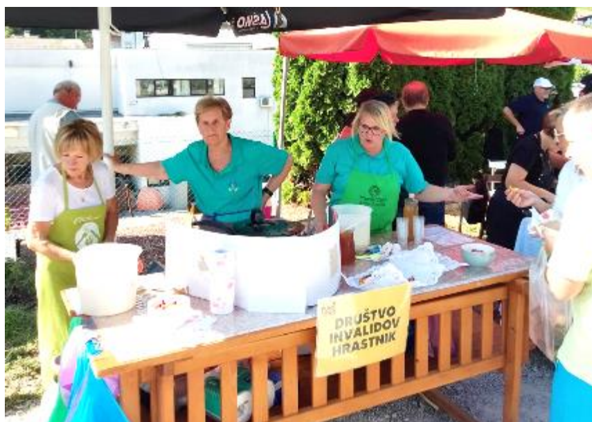
Kakšnega bi raje? Medenega sli slanega?

okusen medeni funšterc, ki je bil sploh prvič na voljo za pokušino na festivalu. Celoten Festival stekla in zasavske kulinarike, ki je tudi letos potekal pri opuščnem rudniškem kompresorju, je bil v sončnem 9. septembru lepo obiskan. Enako velja tudi za stojnico DI Hrastnik. Hvala vsem, ki ste nas obiskali in nam namenili svoj glas. Gremo naprej: važno je sodelovati, ne zmagati!