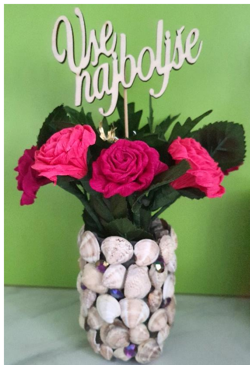
Ličen šopek, ni kaj - iz krep papirja!

V okviru materinskega praznika so se pridne in spretnke Sončnice odzvale povabilu Knjižnice Antona Sovreta Hrastnik in Osnovne šole narodnega heroja Rajka Hrastnik ter prikazale tehniko izdelovanja rož iz različnih materialov. V hrastniški knjižnici so prikazale izdelovanje različnih rož iz krep papirja, biba palčk, mafinov, barvnih plastičnih vrečk in celo iz zaščitnih mask. Zadovoljni otroci in njihovi starši so z veseljem lepili, rezali in zvijali, na koncu pa celo sami sebe presenetili s čudovitimi izdelki. Z učenci 5. razredov Osnovne šole narodnega heroja Rajka, tako v Hrastniku kot na Podružnični šoli Dol pri Hrastniku, pa so Sončnice izdelovale cvetje iz krep papirja. Z izdelanim cvetjem so otroci naslednji dan razveselili svoje mamice za njihov praznik. Delo je potekalo v prijetnem in ustvarjalnem vzdušju. Še zlasti v 5. razredu na Dolu, kjer se je delavnice udeležilo kar 13 dečkov in 2 deklici. Najprej so imele Sončnice sicer malo pomisleka o uspehu delavnice, glede na veliko število dečkov, ki običajno niso ravno bleščeči pri tovrstnih ročnih spretnostih. A dolski dečki petošolci so se več kot le izkazali, presenečenje je bilo popolno. Izpod njihovih rok so namreč nastali čudoviti šopki spomladanskih žafranov, mnogi so izdelali še celo dodatne cvetlice za svoje babice. Čudovite delavnice! Seveda pa gre posebna zahvala učiteljicam in knjižničarkam, ki so sodelovale pri izdelovanju in tudi same ustvarjale skupaj z otroki.