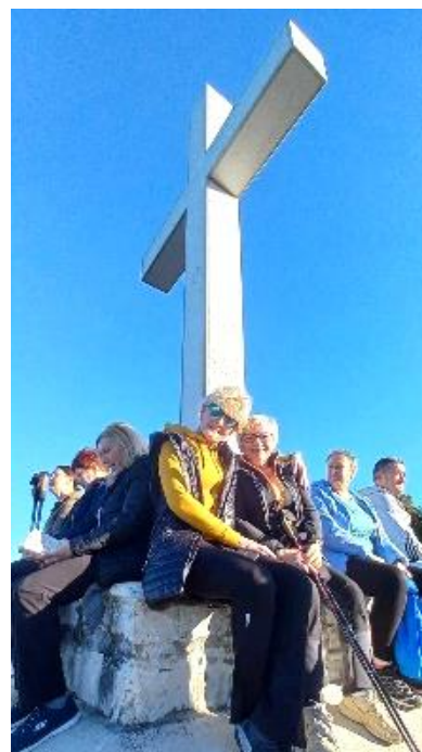
Geli in Sonja sta se sprostiti in razgibali na psihosocialni rehabilitaciji ZDIS v Strunjanu