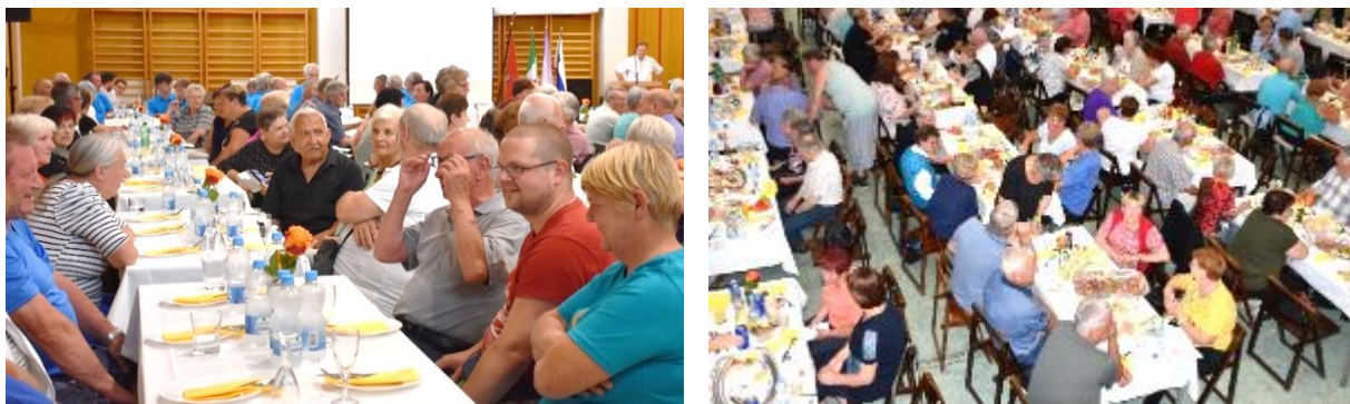
Množično smo proslavili našega Abrahama