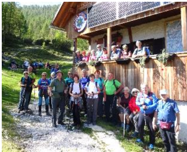
Zadnja skupinska fotografija naših planincev v sezoni 2023