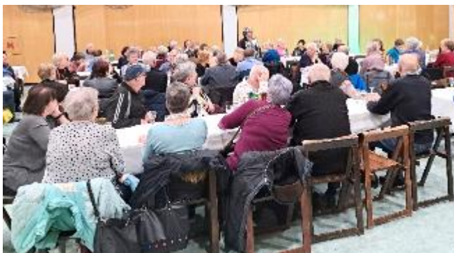
Naš mednarodni dan smo seveda primerno proslavili

Pomembno je zavedanje, da je invalidna oseba enakopraven in enakovreden član družbe, ki lahko prav tako bogati politično, družbeno, gospodarsko in kulturno življenje. To so v svojih govorih izpostavili tudi vabljeni gostje. Uradnemu delu prireditve je sledilo zabavnejše nadaljevanje z ritmi muzikanta Boštjana. Za hrano in pijačo je poskrbela Mesarija Kramžar, naše druženje pa se je končalo z lepimi željami ob bližajočem se božiču in novem letu.