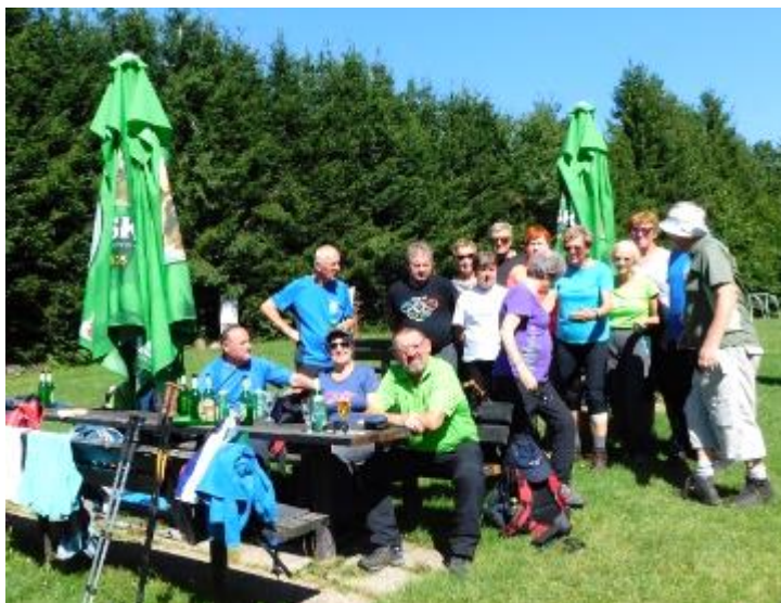
Zaslужen počitek na vrhu Šmohorja

Res lep planinski pohod, za vsakogar nekaj, kar mu je ustrezalo.