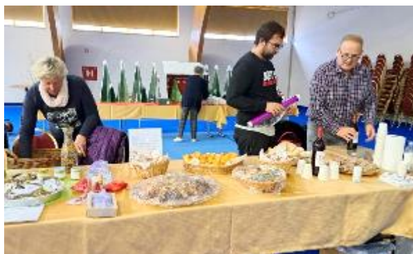
Najprej priprave dobrot in umetnin KOO Zasavje-Posavje

društvu. Gradiva s predavanj in delavnic so vsem zainteresiranim na voljo na sedežu društva.