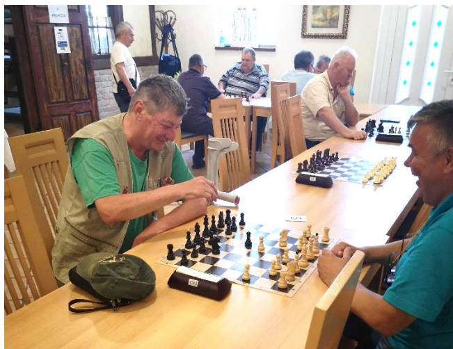
Bilo je napeto in zabavno