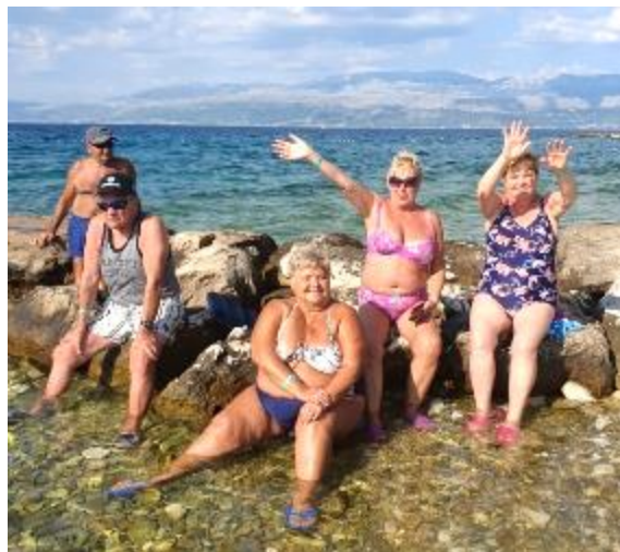
Lep pozdrav s čudovitega Jadrana!

Letovanje je bilo všečno. V prepričanju, da je lahko sleherni član našel nekaj zase iz pestre ponudbe za zagotovitev prijetnega dopusta, vas vabimo, da se nam pridružite tudi naslednje leto.