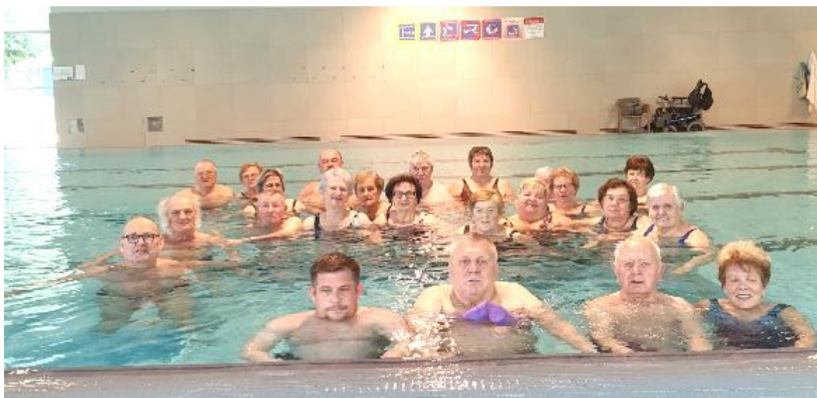
Skupinski pozdrav neposredno iz termalne vode Zdravilišča Laško

Kakor že vrsto let smo tudi letos izvedli dvodnevno kopanje težjih invalidov. Po predlogih poverjenikov je komisija potrdila okoli 50 vlog, toda kopanja 17. in 18. aprila